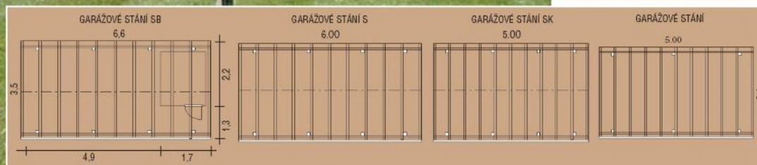
GARÁŽOVÉ STÁNÍ SB